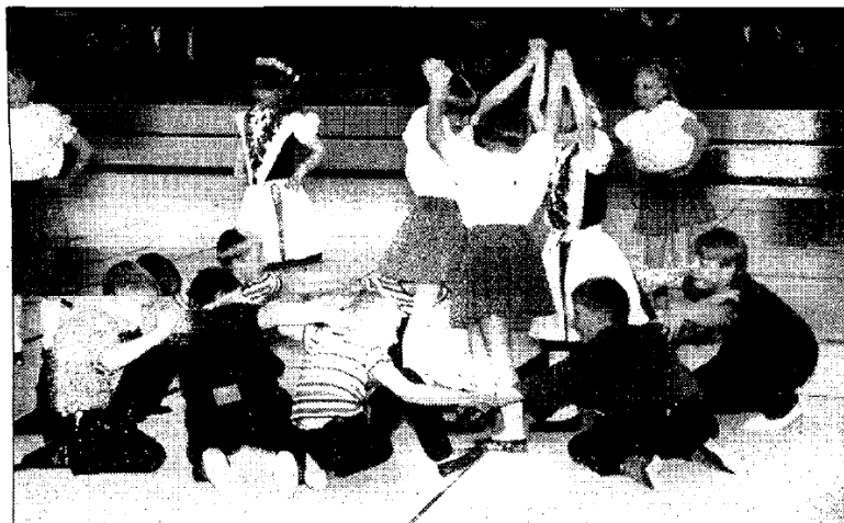
Oficialne přepodaće noweje hale w Radworju: Šulske dźěći předstajichu kulturny a sportowy program.

Radwor (SN/DY). Po tym, zo su so hižo někotre zarjadowanja najwšelakorišeho razu w Radworskej nowej sportowej a wjacezaměrowej hali „Slavia“ přewjedli, je so wona zaštu sobotu nětko tež cyle oficialnje Radworskej gmejnje kaž tež Serbskej zakładnej a Serbskej srjedźnej šuli „Dr. Marija Grólmusec“ přepodała. Z tym je dom sporta a kultury we wobsydstwje tamnych šulerjow a wobydlerjow.