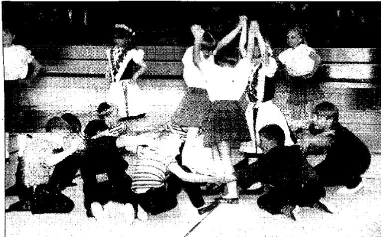
Oficialne přepodaće noweje hale w Radworju: Šulske dźěći předstajichu kulturny a sportowy program.

Radwor (SN/DY). Po tym, zo su so hižo někotre zarjadowanja najwšelakorišeho razu w Radworskej nowej sportowej a wjacezaměrowej hali „Slavia“ přewjedli, je so wona zaštu sobotu nětko tež cyle oficialnje Radworskeje gmejny kaž tež Serbskeje zakładnej a Serbskeje srjedźnej šuli „Dr. Marija Grólmusec“ přepodała. Z tym je dom sporta a kultury we wobsydstwje tamnych šulerjow a wobydlerjow.