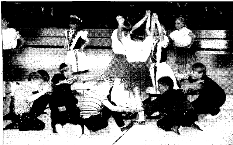
Oficialne přepodaće noweje hale w Radworju: Šulske dźěći předstajichu kulturny a sportowy program.

Radwor (SN/DY). Po tym, zo su so hižo někotre zarjadowanja najwšelakorišeho razu w Radworskej nowej sportowej a wjacezaměrowej hali „Slavia“ přewjedli, je so wona zaštu sobotu nětko tež cyle oficialnje Radworskej gmejnje kaž tež Serbskej zakładnej a Serbskej srjedźnej šuli „Dr. Marija Grólmusec“ přepodała. Z tym je dom sporta a kultury we wobsydstwje tamnych šulerjow a wobydlerjow.