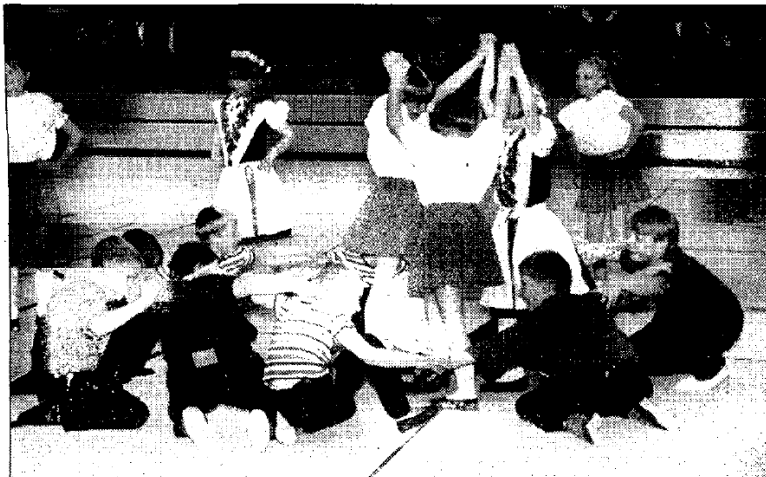
Oficialne přepodaće noweje hale w Radworju: Šulske dźěći předstajichu kulturny a sportowy program.

Radwor (SN/DY). Po tym, zo su so hižo někotre zarjadowanja najwšelakorišeho razu w Radworskej nowej sportowej a wjacezaměrowej hali „Slavia“ přewjedli, je so wona zaštu sobotu nětko tež cyle oficialnje Radworskej gmejnje kaž tež Serbskej zakładnej a Serbskej srjedźnej šuli „Dr. Marija Grólmusec“ přepodała. Z tym je dom sporta a kultury we wobsydstwje tamnych šulerjow a wobydlerjow.