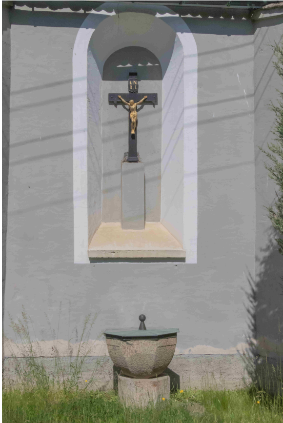
Najstarša Radworska dupa - je prawdopodobnie 800 lët stara! Der älteste Radiborer Taufstein - wohl an die 800 Jahre alt!