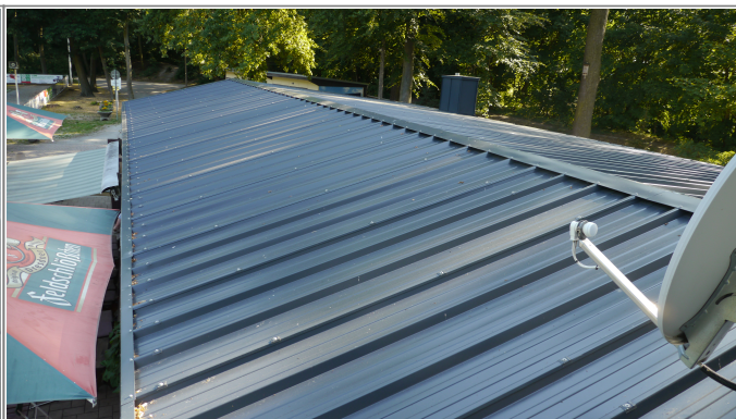
Nowa trěcha z izolaciju za čoplotu Erneueretes Dach mit Wärmeisolierung