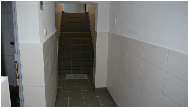
Ponowjena pinčna chódba a schód

Umkleidekabine mit verschließbaren Schränkchen