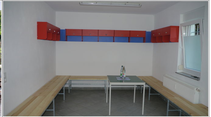
Předrasčenska rumnosť z kamorčkami k zamknjenju

Sportlerheim SV1922 Radibor e.V. mit Hinweis auf die Förderung