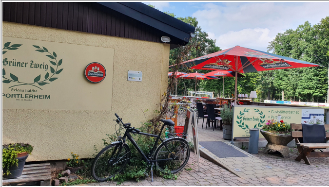
Dom sportowcow SJ1922 Radwor z.t. z pokazku na spéchowanie

Sportlerheim SV1922 Radibor e.V. mit Hinweis auf die Förderung