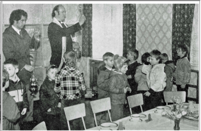
Farski adjutor C. Hrjehor žohnuje rumnosće pěstowarnje Pfarradjutor C. Rehor segnet die Räume im Kindergarten