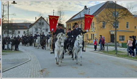
„Naši“ so nawječor domoj wróča „Die Unsrigen“ kommen am Vorabend nach Hause