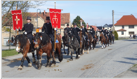
Bačonscy při wotjěchanju Die Storchhaer beim Wegreiten