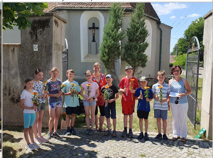
Skupina dźěći, kiž su awdija nahrawali — Kinder, die die Audiosequenzen aufgesprochen haben