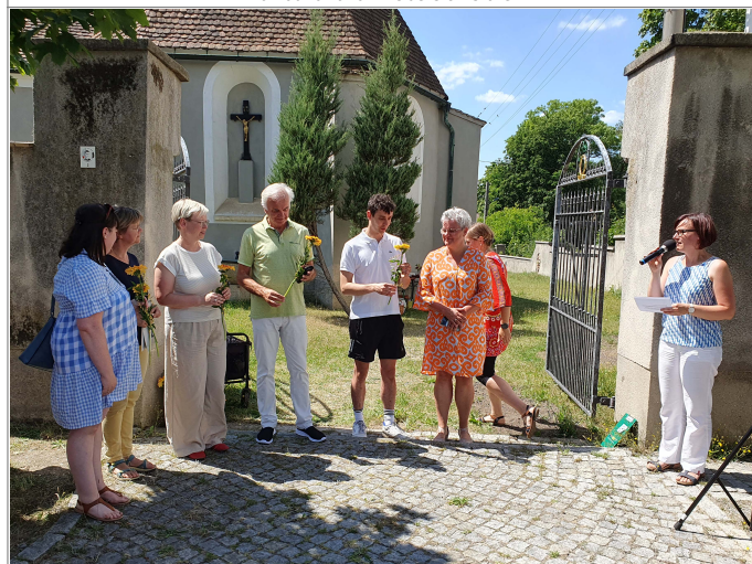
Team podpěračelow a aktiwnych projekta „Alojsowa šćežka“ Das Team der Ideengeber, Unterstützer und Aktiven im Projekt