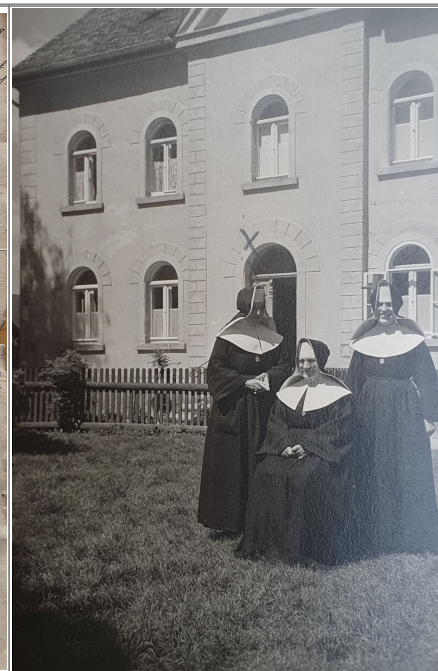
Sotry před hłownym zachodom Die schwestern vor dem Haupteingang